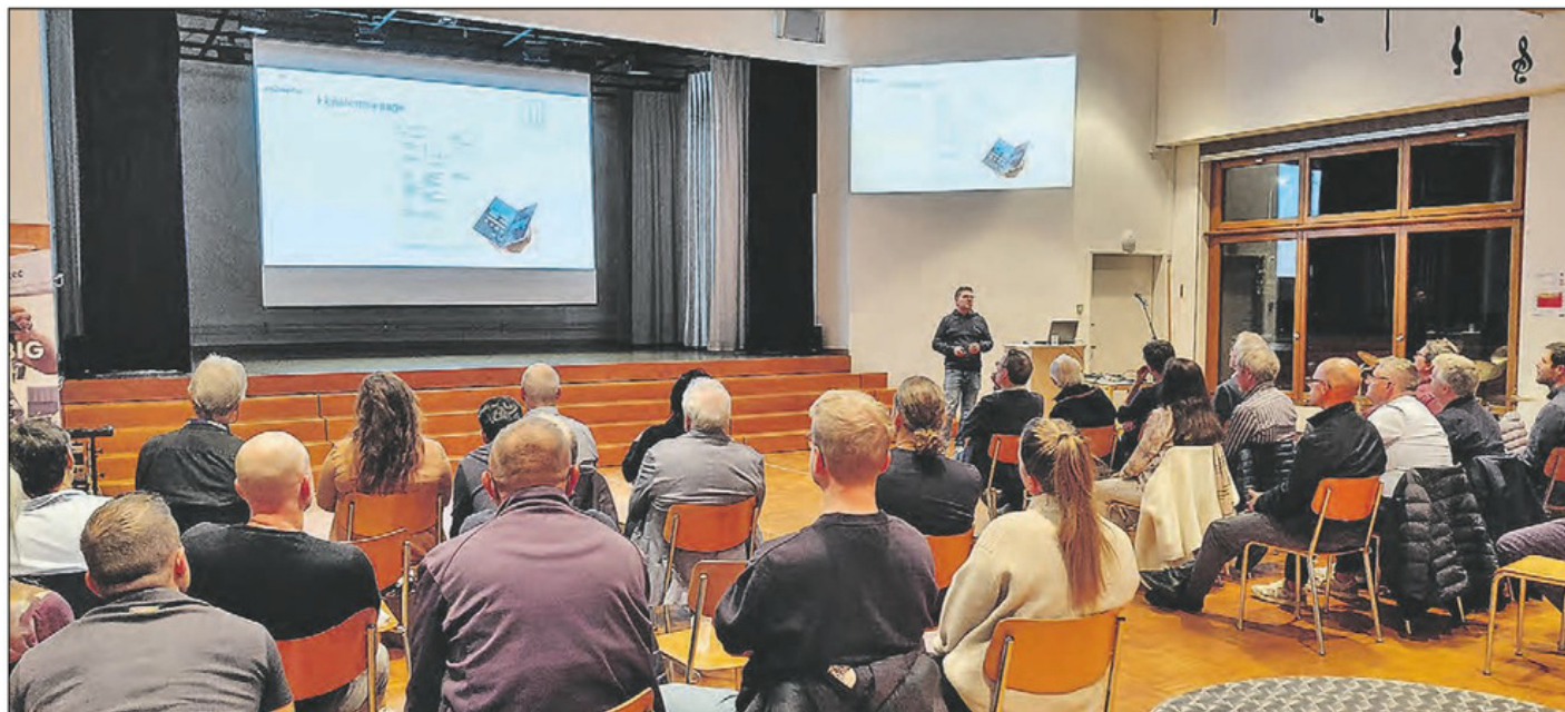
Der Infoanlass zum Thema Digitalisierung stiess auf reges Interesse.

Auftrag: 3011806 Themen-Nr.: 260002 Referenz: 7ac9fbb9-2629-4f70-8b2e-c57124caee5 Ausschnitt Seite: 3/3